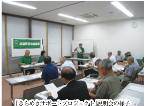
「きらめきサポートプロジェクト」説明会の様子

地域コミュニティの活性化や福祉、防災、文化振興など、さまざまな課題の解決につながる取り組みを支援します。