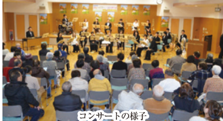
コンサートの様子

スポーツ大会、地区運動会、地域文化祭等のイベントは、日ごろの活動の発表の場や文化・スポーツを通じた貴重な交流の場にもなっています。