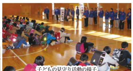
子どもの見守り活動の様子

地域の子供たちの交通安全、不審者対策等のために、通学路内の横断歩道付近や集団登校時に見守り活動を行っています。