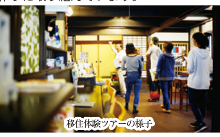
移住体験ツアーの様子

県外から秋葉区に移住する人・移住を希望する人向けに「移住体験ツアー」を区と協働で行うなど、移住・定住の仕組み作りに取り組んでいます。