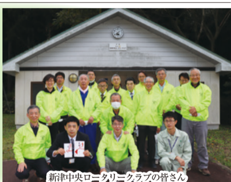
新津中央ロータリークラブの皆様