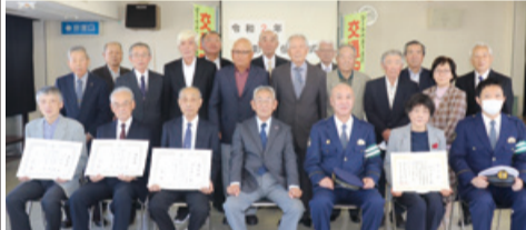
表彰された皆さんと秋葉警察署小山署長(右から3人目)ほか

長年の交通安全功労に対し、関東連名表彰、緑十字銅章等の伝達式が行われました。皆さん、おめでとうございます。