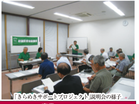
「きらめきサポートプロジェクト」説明会の様子

地域コミュニティの活性化や福祉、防災、文化振興など、さまざまな課題の解決につながる取り組みを支援します。