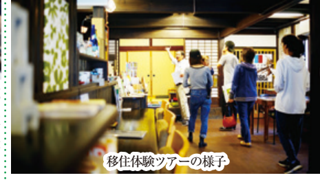
移住体験ツアーの様子

県外から秋葉区に移住する人・移住を希望する人向けに「移住体験ツアー」を区と協働で行うなど、移住・定住の仕組み作りに取り組んでいます。