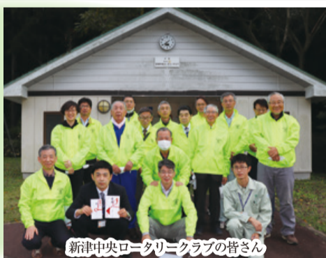
新津中央ロータリークラブの皆様