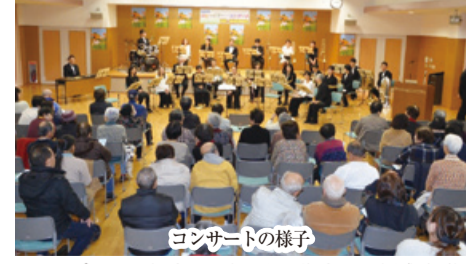
コンサートの様子

スポーツ大会、地区運動会、地域文化祭等のイベントは、日ごろの活動の発表の場や文化・スポーツを通じた貴重な交流の場にもなっています。