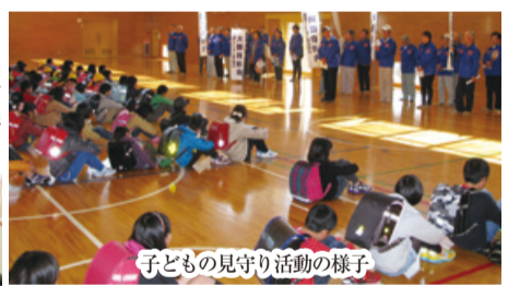
子どもの見守り活動の様子

地域の子供たちの交通安全、不審者対策等のために、通学路内の横断歩道付近や集団登校時に見守り活動を行っています。