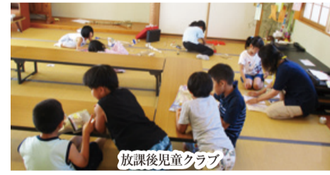
放課後児童クラブ

放課後や学校の長期休み(春休み・夏休み・冬休み)に子どもたちが安心して過ごせるような居場所づくりとして、放課後児童クラブを開設しています。