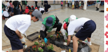
矢代田駅前の花植えの様子