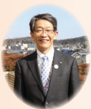
秋葉区長 夏目久義