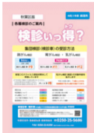
冊子「各種検診のご案内」