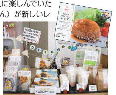
取扱店 うららこすど