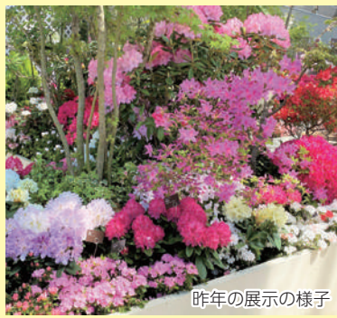
昨年の展示の様子