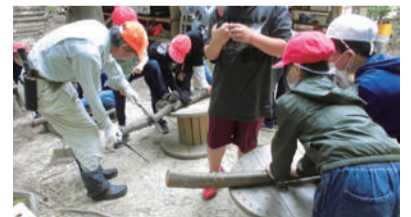
ノコギリの使い方を教してもらいながら丸太切りの体験をしました