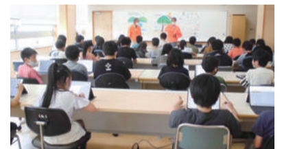
里山についての講話を聞きました