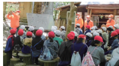
森の木や花の種類を教してもらい、季節ごとの変化を観察しました