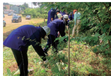
小学生の時に植樹した木の下の草刈りをしました

金津中学校では、昨年度1年生26人が朝日の森保全活動に参加しました。普段、なかなか足を踏み入れない朝日の森に関わり、金津地区の良さを再認識することができました。