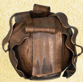
工芸 最優秀賞「リボン」