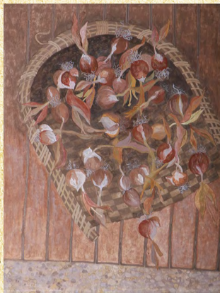
日本画 最優秀賞 「また咲くのが楽しみ」

10月15日から23日まで、新津美術館で開催された「第16回秋葉区美術展」の入賞者と最優秀作品を紹介します(敬称略)。 問い合わせ 新津地区公民館(☎22-9666)