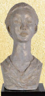
彫刻 最優秀賞「和み」