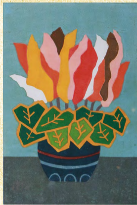
版画 最優秀賞 「Flower」