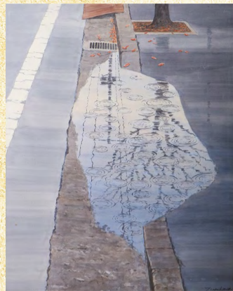
洋画 最優秀賞 「秋雨の路肩」