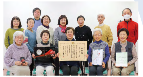
音声訳 さやの会の皆さん

長年にわたり、視覚障がい者の在宅福祉サービス充実のためにボランティア活動をしてきた「音声訳さやの会」が厚生労働大臣表彰を受賞されました。同会は、昭和54年から活動を始め、あきは区役所だよりや秋葉区社協だより、図書などの内容を音声で録音し、視覚障がい者に情報を届けています。