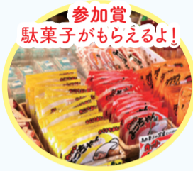
参加賞 駄菓子がもらえるよ!

秋葉区を巡って、たくさんの魅力を見つけよう!期間中に3つのミッションの写真を撮って応募すると、抽選で「秋葉区魅力たっぷりプレゼント」が当たります。夏休みにたくさんの思い出を作りましょう!皆さんの思い出の写真、お待ちしております!