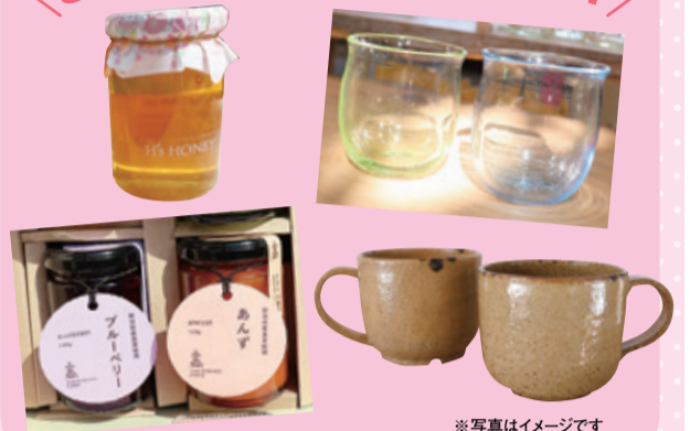
※写真はイメージです 応募用紙・応募箱は各店舗にあります