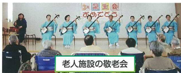
老人施設の敬老会