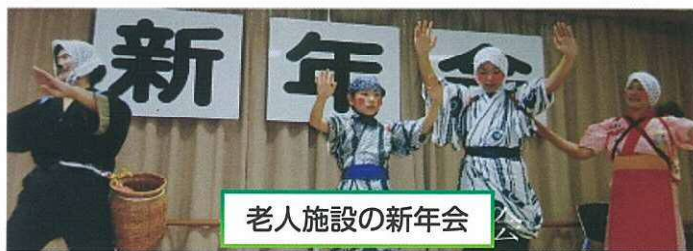
老人施設の新年会