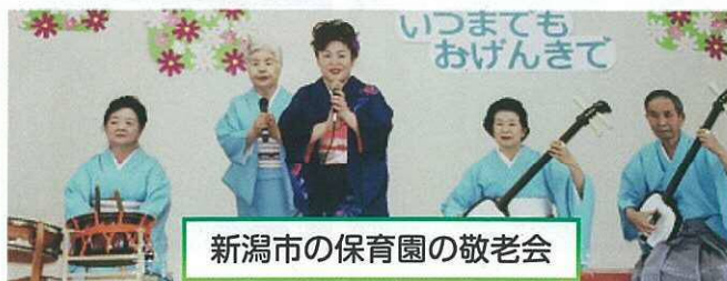
新潟市の保育園の敬老会