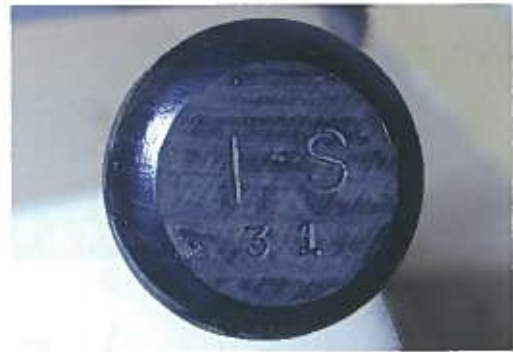
ミズノ：イチローモデル『グリップエンドに I・S 31 彫刻』イチロー鈴木、背番号31

次男が小学校6年生の時に五中野球部は練習用に高校野球用木製バットを使っていることを聞きましたので、次男にも910gのイチローモデルを持たせました。