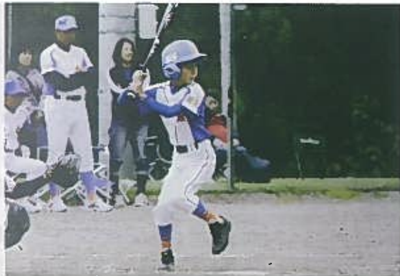
6年生：ローリングス【ビッグスティック】 75cm 690g