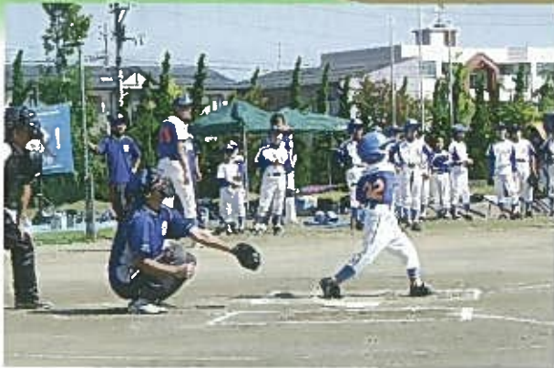
4年生：ミズノ 70cm 400g