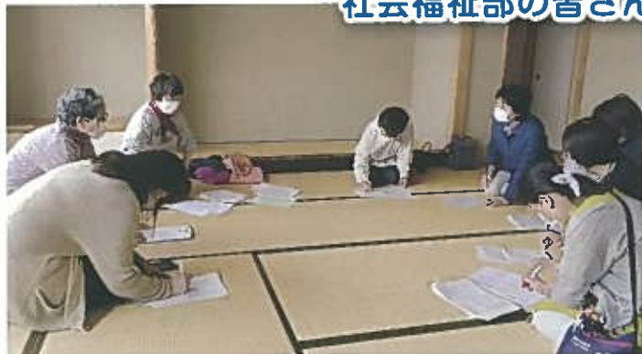
社会福祉部の皆さん