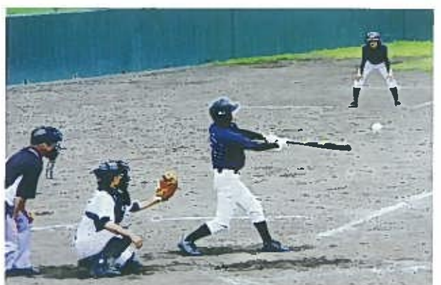
中学3年：SSK【スカイビート31】高反発 82cm 910g ミドルカウンター

ヒットを打つ必須ポイントは、体格に合ったバットの長さや重さにあります。振れる限り長く長くです。練習してバットスピード・バットコントロールがアップするとイチローになれます。