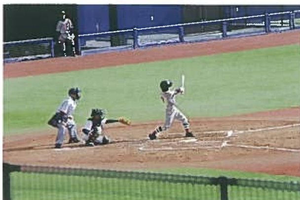
中学1年：野球部のバット ミズノ 80cm 800g