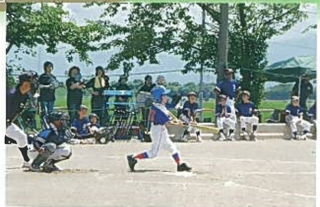
5年生：ハイゴールド 73cm 530g