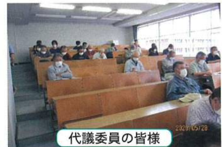
代議員委員の皆様