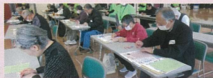
また わぁーりなったな!