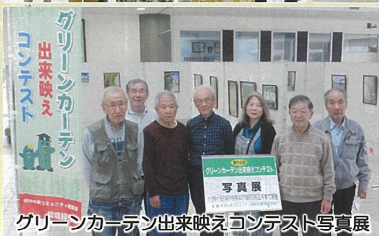
グリーンカーテン出来映えコンテスト写真展