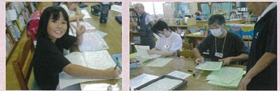
がんばってるわよ！ ~スタッフも頑張ってるぞ~