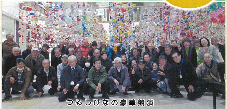
つるしびなの豪華競演