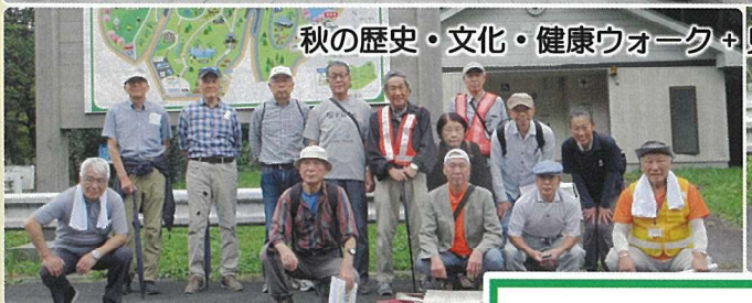
秋の歴史・文化・健康ウォーク+見学会