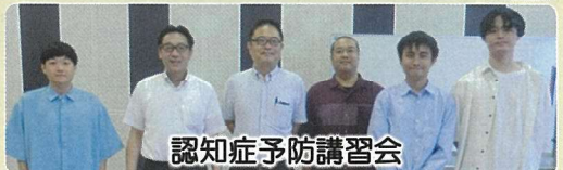
認知症予防講習会

明けましておめでとうございます。それぞれのご家庭で、どんなお正月を迎えられたでしょうか。新津中央コミ協は、1月6日から令和7年が始まりました。2月からのつるしびなの豪華競演を控え準備を進めております。今年も皆様に参加していただけるものを中心に活動してまいります。よろしくお願いいたします。