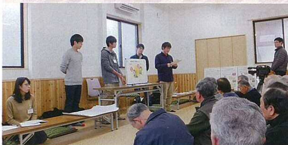
(学生による糖尿病と脂質異常症についての説明)