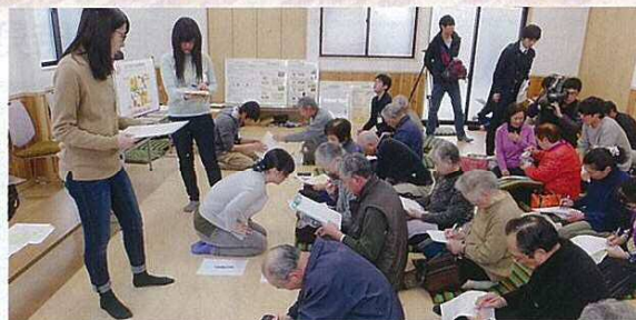
(アンケート記入を通して学生と交流)

2月20日(土)の午前から午後にかけて、新津中央コミュニティ協議会エリアの4会場で新潟薬科大との連携モデル事業「健康・自立セミナー」がスタートしました。これは、薬学部の学生がチームを組んで、セミナーの開催を希望する町内に出向いて、地域住民に健康管理や疾病予防のプレゼンテーションをしながら地域住民の健康維持を図ろうとする試みです。今後はテーマを変えながら、隔月で年6回開催されますので、お気軽にご参加ください。