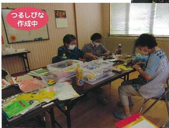
つるしびな 作成中