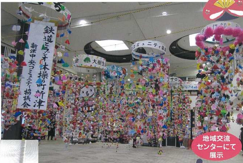
地域交流 センターにて 展示

このつるしびなは文化祭及び、2月 1日～3月5日まで地域交流センターで 開催された〈秋葉区ひな・お宝巡り〉 に展示されました。来年もみんなで 参加しましょう。