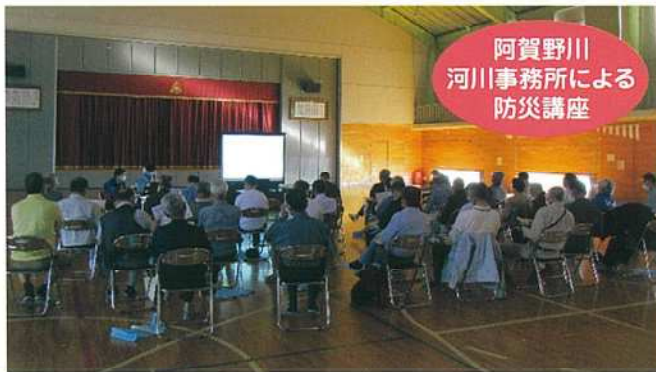
阿賀野川 河川事務所による 防災講座