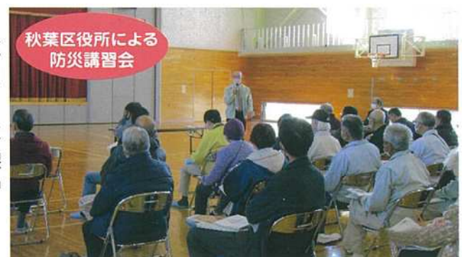
秋葉区役所による 防災講習会

令和4年11月6日（日）満願寺町内会・七日町町内会単位で避難訓練を実施しました。満願寺町内会では、情報伝達訓練・高齢者等要支援者などの避難訓練、七日町町内会では、情報伝達訓練をそれぞれ実施した後、旧満日小学校体育館において、避難所運営委員関係者が参加し、秋葉区地域総務課安心・安全係から避難所運営委員会の役割等について講習会を行いました。