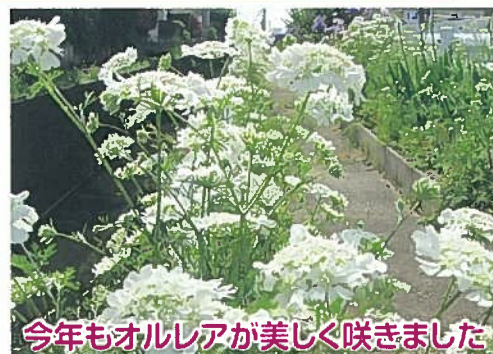
今年もオルレアが美しく咲きました

※スギナ等の雑草に変わり! 昨年、コミセンで配った種は、皆様の所でも咲いたでしょうか? (種まき時はいつでもOKです) ※荻川地区を花いっぱい!