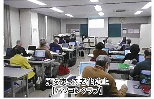
頭を使って老化防止 【パソコンクラブ】