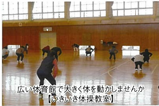
広い体育館で大きく体を動かしませんか 【いきいき体操教室】

荻川いきいき塾の運営は、荻川地区住民をもって構成し、健康寿命を伸ばすためのさまざまな活動をしています。参加者の年齢は60～90歳代で、総勢260名強の皆さんが活動しております。屋外事業(旅行)年2～3回バス旅行を実施予定。屋内事業は9種類12教室があります。各教室に一度、見学に来られて良かったら参加されますようお願いしております。