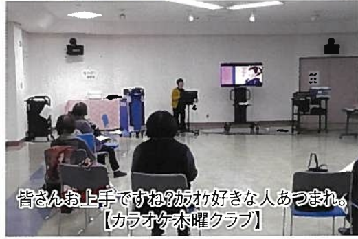
皆さんお上手ですね?ががが好きな人あつまれ。 【カラオケ木曜クラブ】