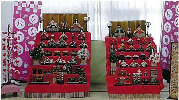
※ご協力を頂きました関係団体様

敬愛こども園、荻川ほのぼの保育園、小阿賀ほのぼのこども園、新潟市立結幼稚園、新潟市立市之瀬幼稚園、新潟市立結小学校、新潟市立荻川小学校、荻川折り紙クラブ、荻川折り紙サークル、荻川レディー (敬称略・順不同)