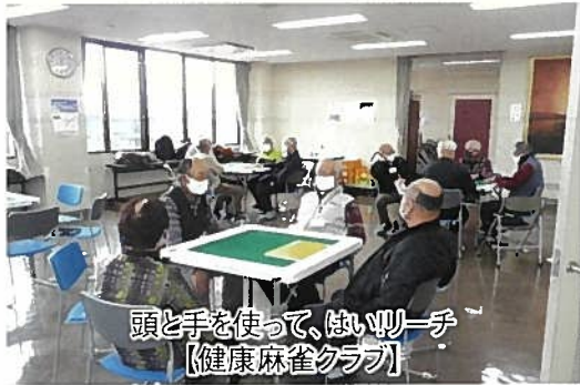
頭と手を使って、強い一手 【健康麻雀クラブ】