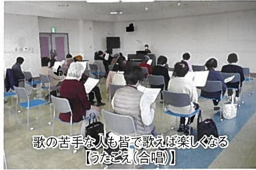
歌の苦手な人も皆で歌えば楽しくなる 【うたごえ(合唱)】