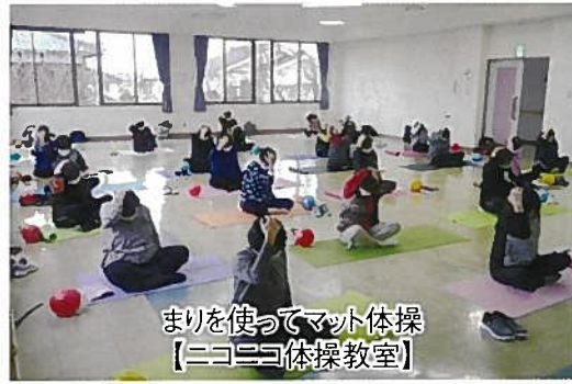
まりを使ってマット体操 【ニコニコ体操教室】