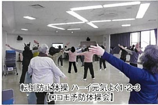
転倒防止体操 ハイ元気よく1・2・3 【回コモ予防体操会】