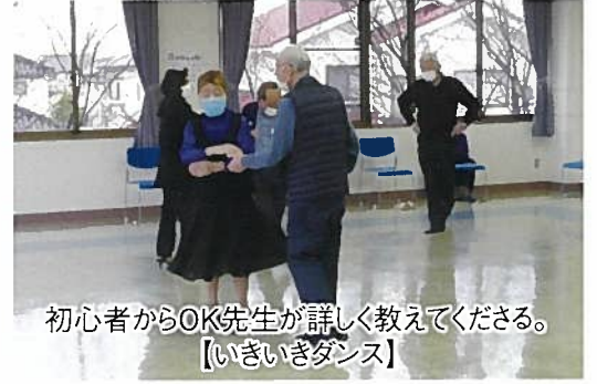
初心者からOK先生が詳しく教えてください。 【いきいきダンス】