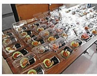
荻川子ども食堂 スタッフ

おぎかわ 子ども食堂開催 昨年12月25日、クリスマス当日に「おぎかわ 子ども食堂」を開催しました。 クリスマス寒波の影響で、お客さまは49名(子供33名、大人16名)と少ない参加者となりましたが、皆さん楽しんでくれた様子が伺われました。 和室では手品と絵本の読み聞かせを喜んで貰いました。手品はつ終わる度に大きな拍手で賑わいました。子供たちの声で「どうなってるんだよ」「おかしいぞ」という声が聞こえて盛況でした。絵本の読み聞かせでの場面では、子供さんはお父さんの膝の中に座り、安心感で満ちあふれる表情をして聞いていました。 機能訓練室では、子供たちが折り紙、竹とんぼ、輪投げをして遊んでいました。 最後、帰るときに「おにぎり・唐揚げ」「お菓子」「みかん」を貰って、子供たちは「ありがとうございます」と言ってお帰って貰いました。 寒い中、ご参加頂きました皆さん、ボランティアでお手伝いを頂きました皆さん、大変ありがとうございました。次は会食できる食堂が開けると良いですね。 今回は、3/26(土)開催予定です。