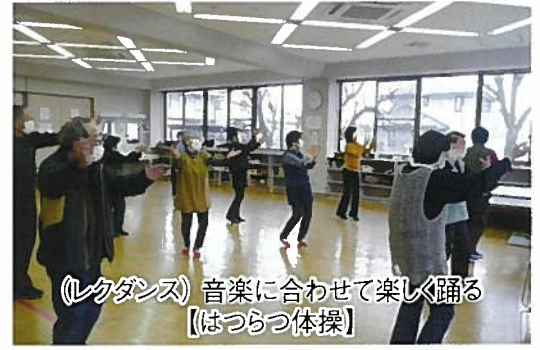
《レクダンス》音楽に合わせて楽しく踊る 【はつらつ体操】