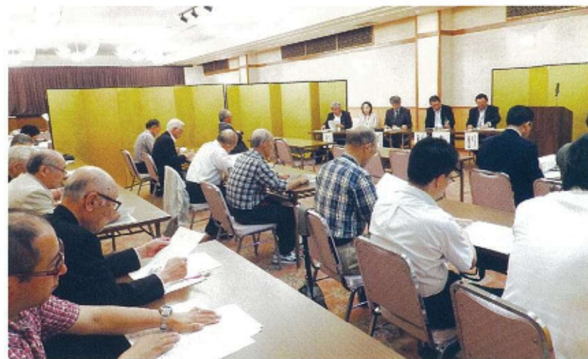
大勢の地域・各団体代表の皆様からご出席いただきました。

本年度も地域の皆様から様々なご支援を頂きながら西部コミ協の活動を続けさせていただきますので、引き続きのご協力をお願いいたします。