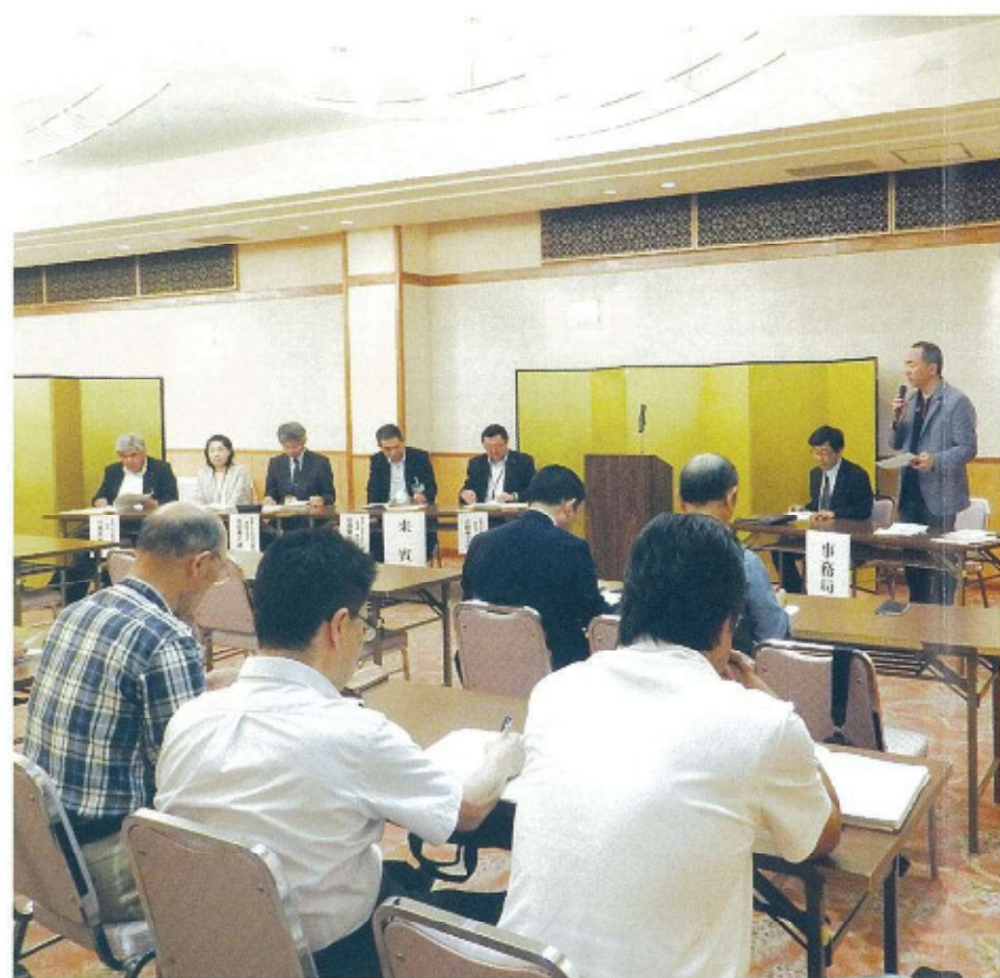
事務局からの各種説明に対し、ご審議いただきました。