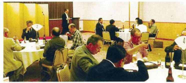
〈懇親会〉 秋葉区役所・社会福祉協議会・地域団体代表の方々との意見交換も行われました。