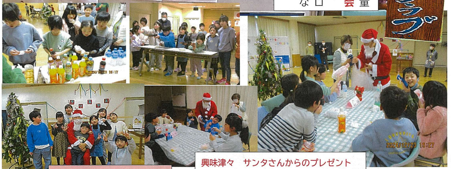
興味津々 サンタさんからのプレゼント