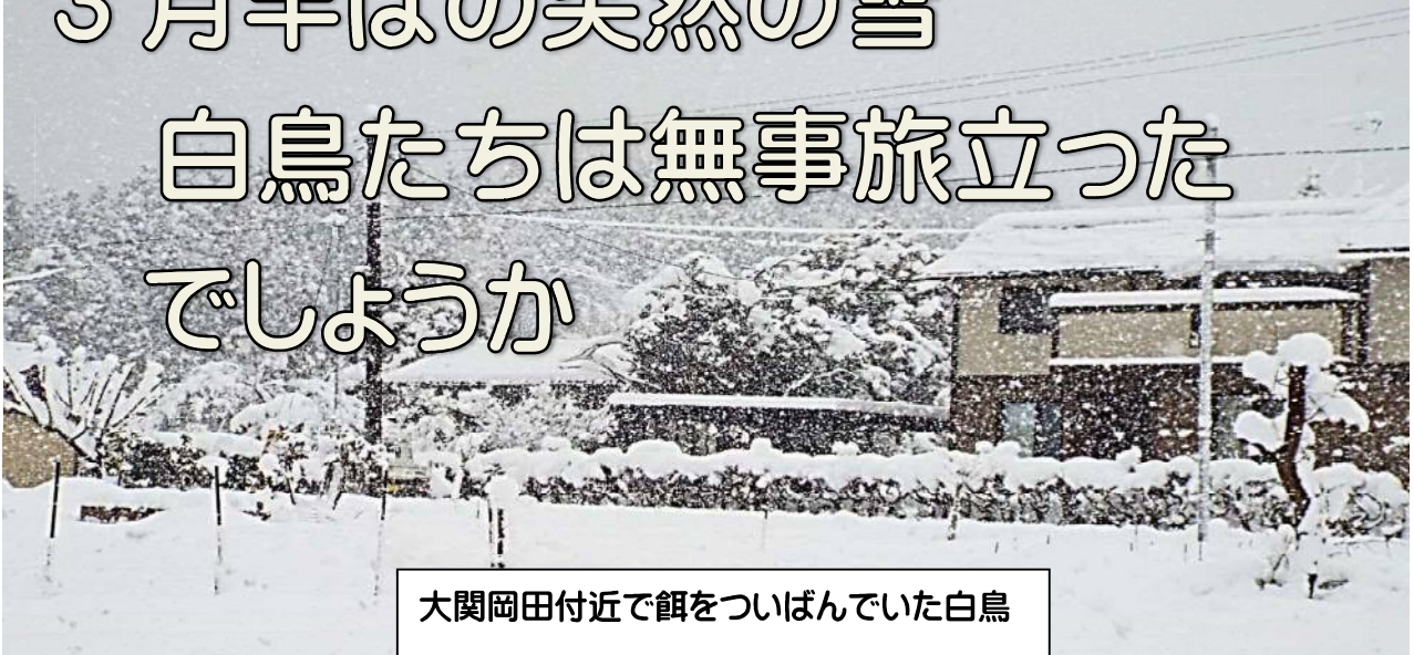
大関岡田付近で餌をついばんでいた白鳥