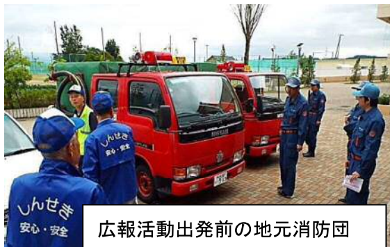
広報活動出発前の地元消防団