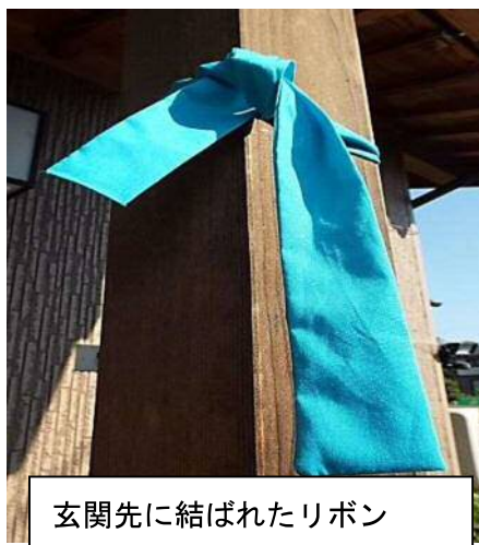
玄関先に結ばれたリボン