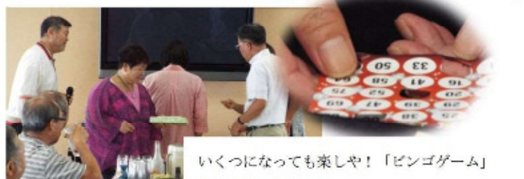
いくつになっても楽しや！「ビンゴゲーム」