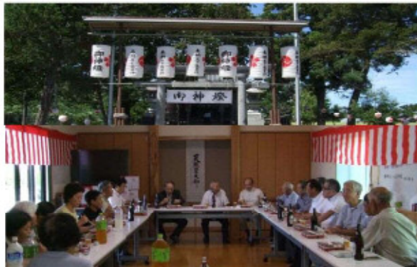
市 新： 水神社の祭礼。五穀豊穰、地域の安心安全などを祈願しました。

今回は、下新・新郷屋・六郷・小口・市新の自治会から写真をいただきましたのでその一部を紹介いたします。