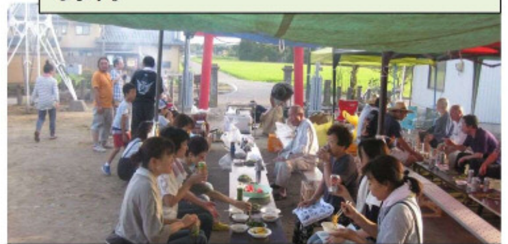
新郷屋： 地域をあげてのバーベキュー大会。地域の和と輪が広がっています。今後もぜひ継続を！