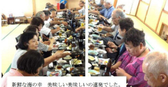
新鮮な海の幸 美味しい美味しいの連発でした。