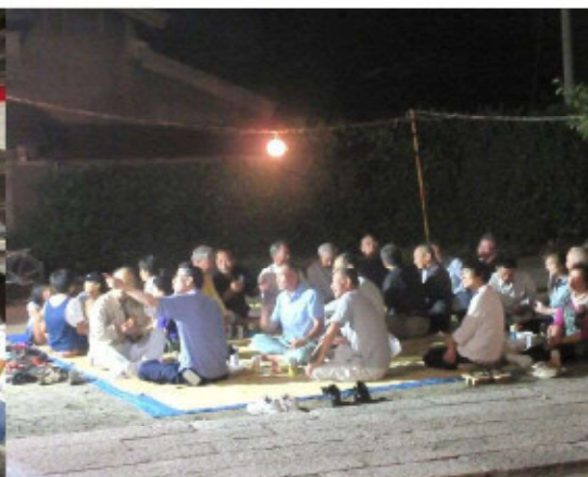
六 郷： ・手作りの夜店 ・子供の笑顔 ・和気あいあいの顔、顔、顔 ゆく夏を惜しむかのような風情が写真から伝わってきます。