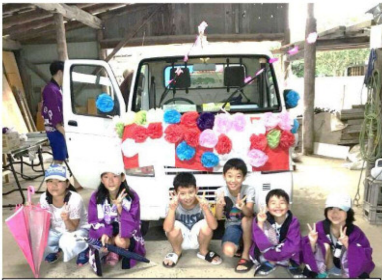
下 新： 軽トラックを使っての子供神輿。 いろいろな意味で時代の流れを感じさせます。