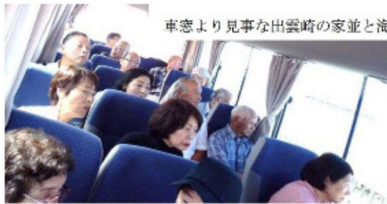
車窓より見事な出雲崎の家並と海を見る。感動！