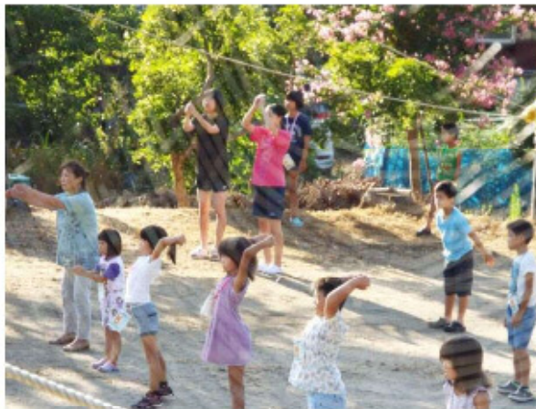
小 口： 夏休みの定番風景です。大人や高校生も交じってのラジオ体操。大人は普段使わない筋肉を伸ばし、悲鳴。 夏祭り樽神輿もにぎやかに行われました。