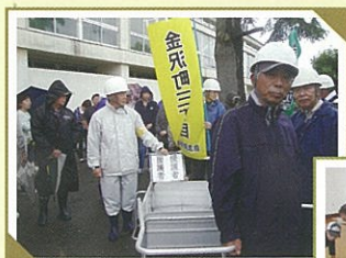
▲要支援者搬送訓練