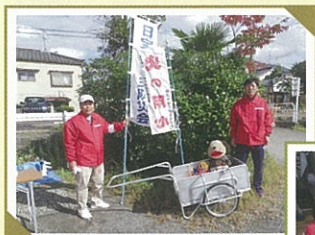
▲要支援者搬送訓練