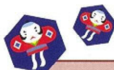
手作りの たこあげ