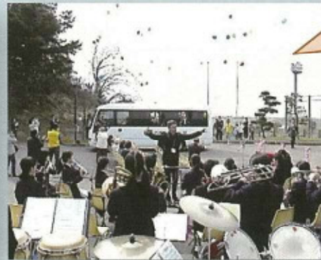
小須戸中学校吹奏楽部による演奏