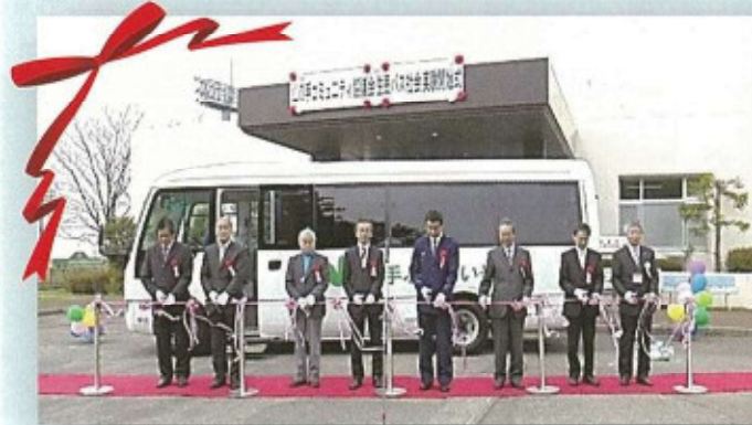
来賓によるテープカット

しかしながら、実際に住民バスが走ってみると『時刻表通りにバスが来ない』『バス停に掲示してある時刻表がわかりにくい』『乗りたい時刻のバスがない』等、様々な問題が出てきました。山の手地区住民バス運行委員会ではこのような地域住民の声をくみ取り、より利用しやすい住民バスとなるよう見直しや改善を行います。皆様におかれましては、今しばらく温かい気持ちでお待ちください。