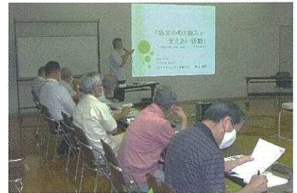
防災の勉強会の様子