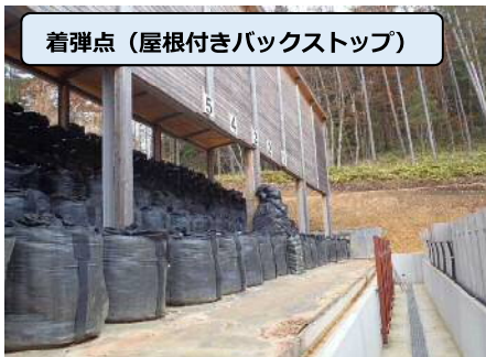
着弾点（屋根付きバックストップ）