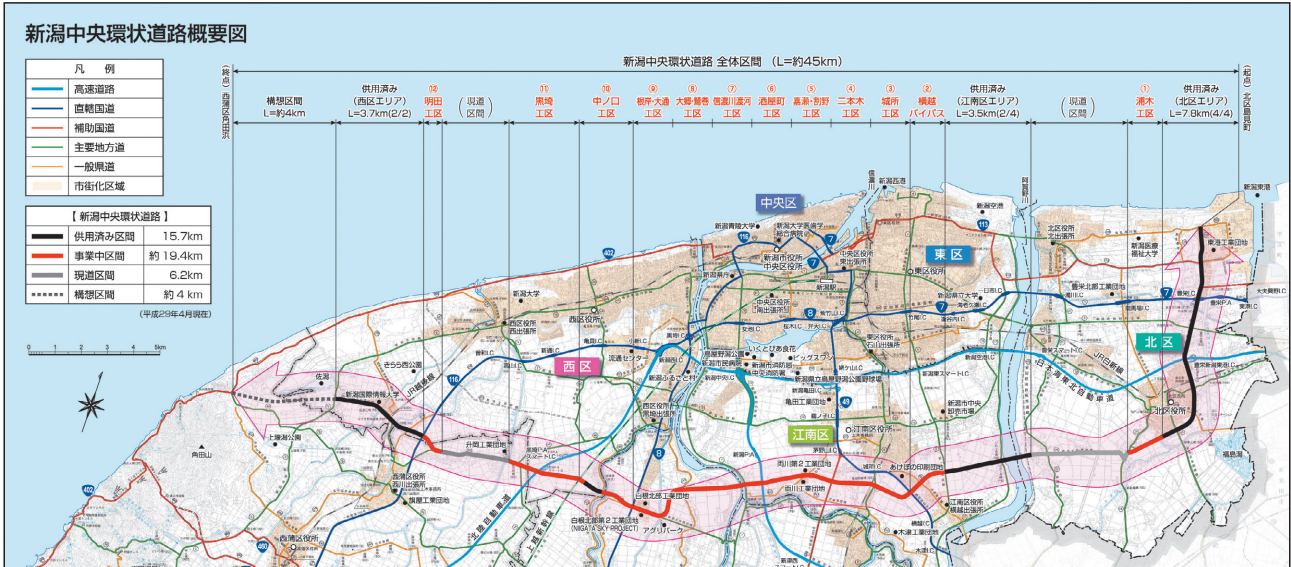
※この地図は、国土地理院発行の5万分の1地形図を縮小したものである。

本市が目指す多核連携型の都市構造において、各地域拠点を環状に連絡する重要な幹線道路であり、安心して暮らせるまちづくりに寄与します。