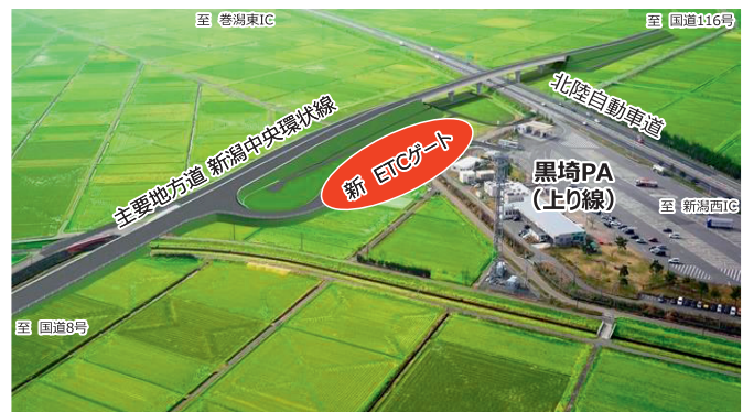
黒埼スマートIC (上り) 整備イメージ