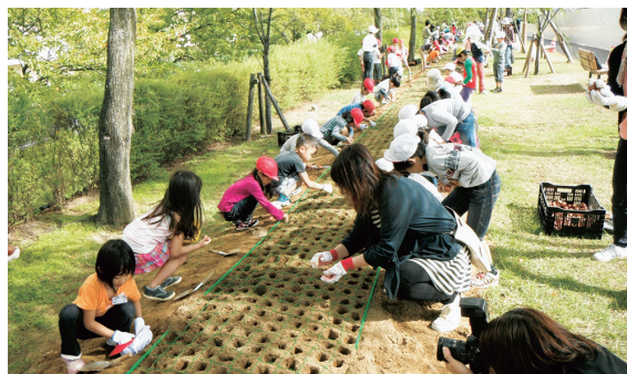
信濃川やすらぎ堤チューリップ植栽