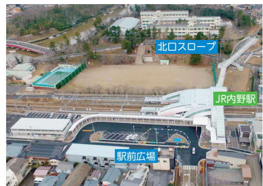
内野駅周辺整備事業完了