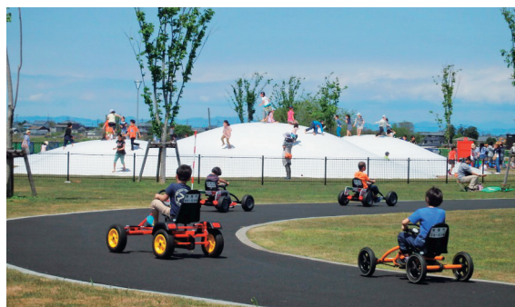
公園整備 (きらら西公園)