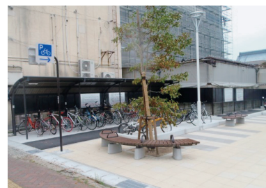
西堀通6番町自転車等駐車場

これに基づき、車道の左側通行を啓発する自転車走行空間の整備（矢羽根等）や、駐輪場の整備、放置自転車対策、自転車利用ルールの周知を進めていきます。