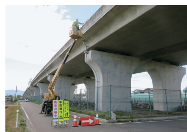
豊栄東跨線橋点検の状況