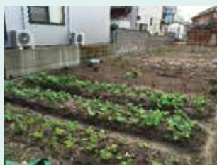
空き家を除却した跡地を「地域の菜園」として活用した例（中央区）

空き家を資源としたまちづくりや地域コミュニティの活性化を図るため、空き家の活用・跡地活用に係る費用の一部を助成します。