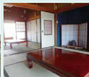
空き家を「地域の茶の間」に改修した例（北区）