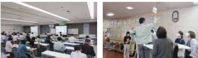
座学研修と実地研修のようす

施設の日常点検を適切に行えるよう、座学及び現地における研修会を継続的に開催するとともに、点検マニュアルを整備し、管理者の意識とレベルの向上を図っています。