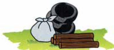
産業廃棄物等の不法投棄