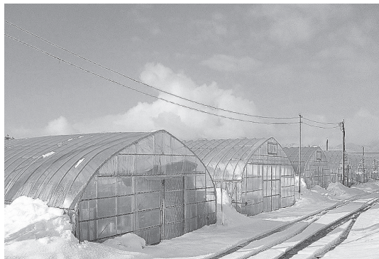
水田転作で導入した園芸ハウス

ここで作れるだけコメを作っては、価格の暴落はもとより、50年に渡って取り組んできた生産調整の努力が報われない。そして、やり場のないコメがあふれてしまい、