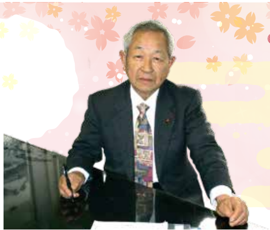
新潟市西蒲区農業委員会