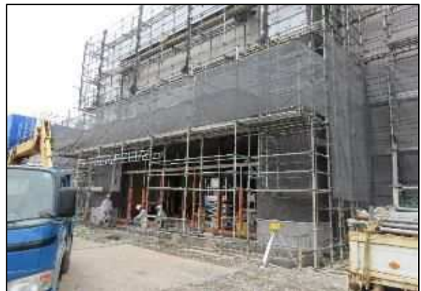
【写真⑫】建物2正面（ニトリ）