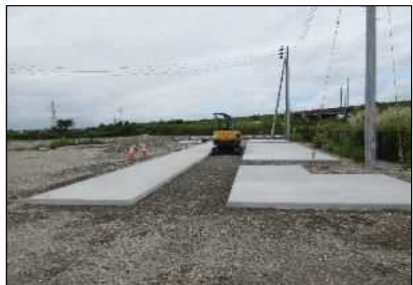
【写真⑧】 駐輪場 7