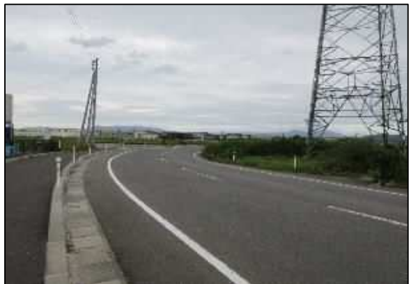
【写真⑥】 出入口 4 南側道路