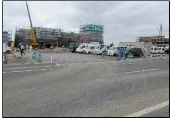
【写真②】 出入口 2