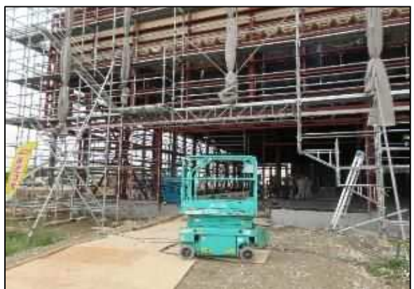
【写真⑯】建物3正面（ダイレックス）