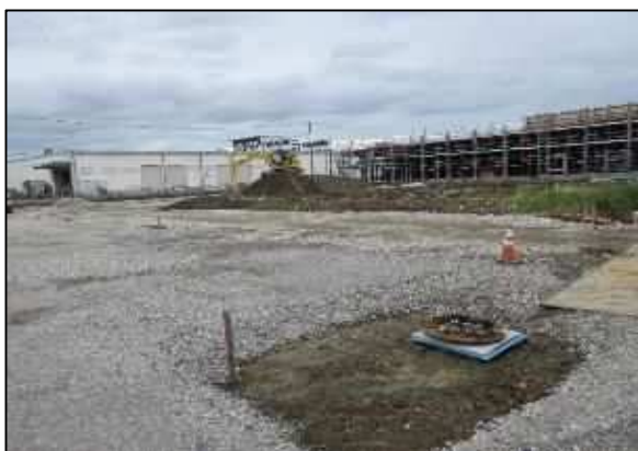
【写真⑮】従業員共用駐車場