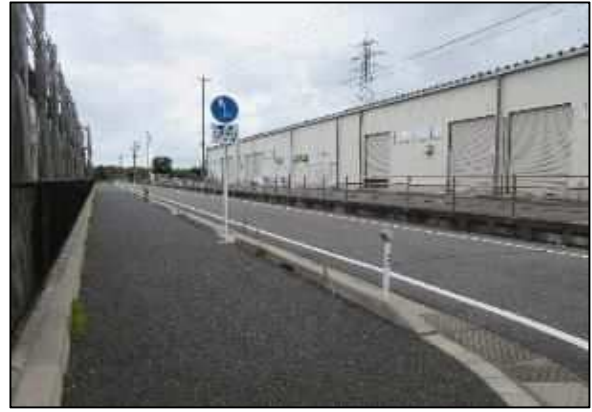
【写真⑱】市道新津1-410号線北側