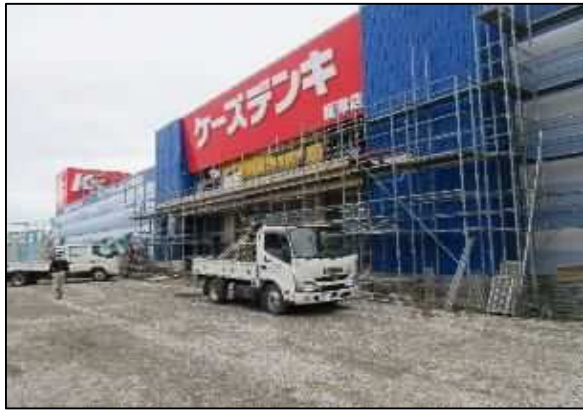
【写真⑨】建物1正面（ケースデンキ）