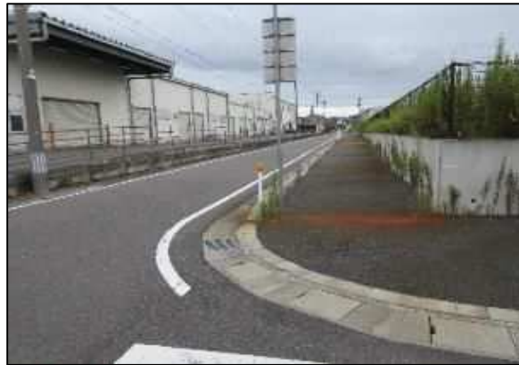
【写真⑲】市道新津1-410号線南側