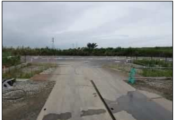
【写真④】 出入口 4 (駐車場側より)