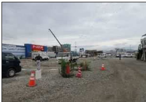
【写真⑦】 駐車場 (舗装前)