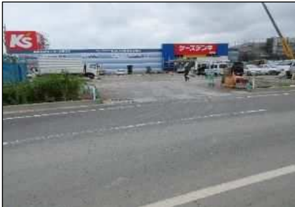
【写真③】 出入口 3