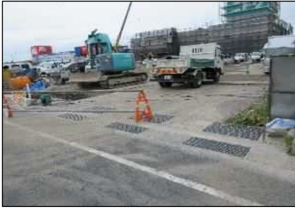
【写真①】 出入口 1