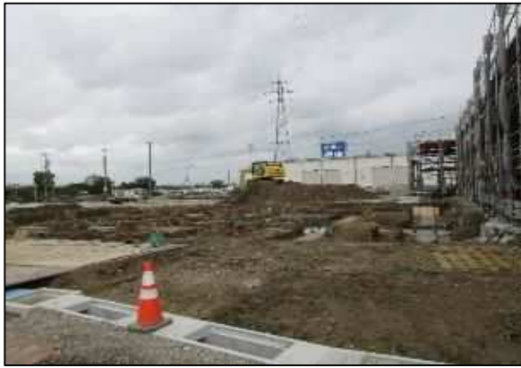
【写真⑰】建物4正面（ラクマン(基礎工事中)）