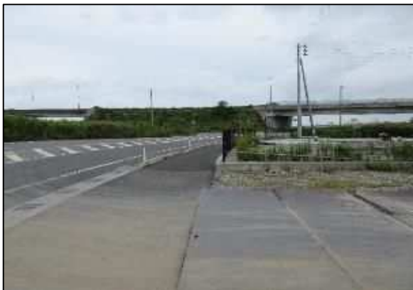
【写真⑤】 出入口 4 (山谷北IC側)