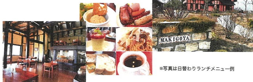
※写真は日替わりランチメニュー例

♪ ランチは、薔薇の香り漂う庭を抜けた、古民家風の人気レストラン、蔦小屋 天井の高い広々とした店内を貸切にしました。 ここでは、ハーフランチコース (季節の前菜盛り合わせ/季節の Pasta / 越後もち豚のグリルor お魚コース/ デザート。パン、コーヒー) を ゆったりと召し上がっていただけます。