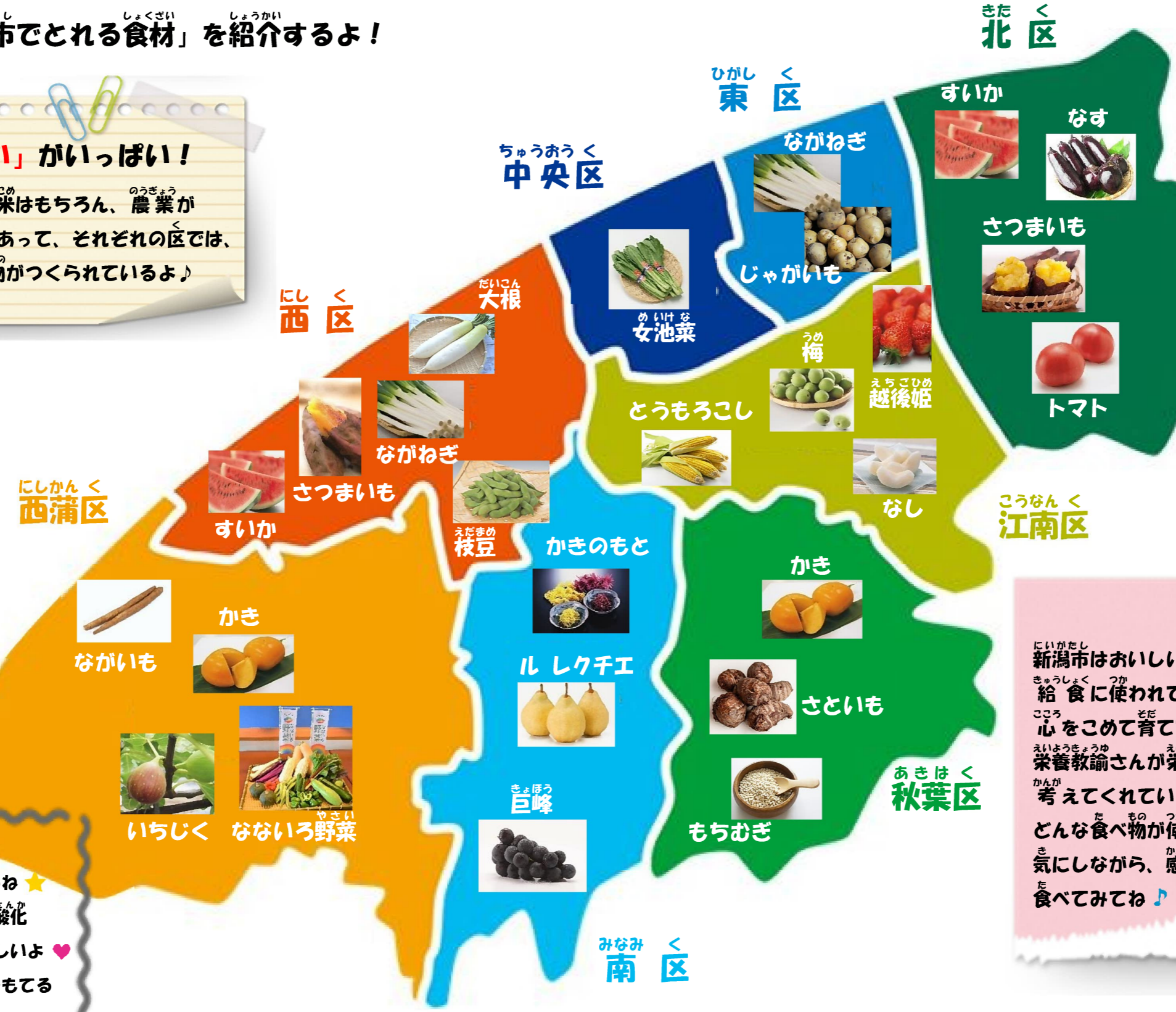
新潟市食育・花育推進キャラクター まいかちゃん

新潟市はおいしい食べ物の宝庫だね! 給食に使われている野菜や果物は、農家さんが心をこめて育てているよ。給食の献立は、栄養教諭さんが栄養や旬、地元のものを工夫して考えてくれているよ★ どんな食べ物が使われているか、気にしながら、感謝の気持ちをもって食べてみてね♪