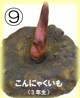
こんにゃくいも (3年生)