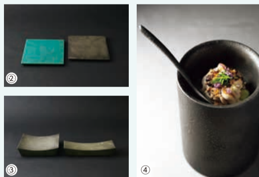
写真①中央の丸皿：べにいしぬり(紅石塗)、左下の箸：若竹塗(若竹塗) 写真②左：緑青塗 写真③ 麿銀塗 写真④ 麿銀塗 ※貸し出し対象外