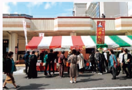
食会場(万代シティ)