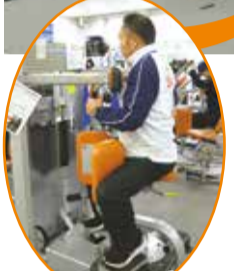
脇腹をツイストして引き締め!