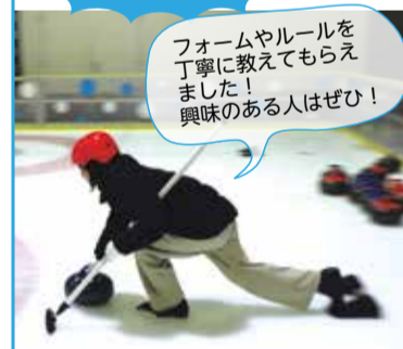
フォームやルールを丁寧に教えてもらえました! 興味のある人はぜひ!