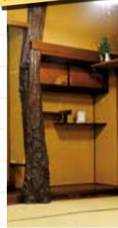
旧割烹有明内の柱