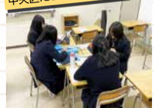
中央区だより作成の様子

私たちは古町芸妓との出会いを通して、古くからの伝統を変わらず今に受け継いでいることに魅力を感じました。古町花街と芸妓の歴史や文化を新潟市の「魅力」の一つとして、多くの人に興味を持ってもらうためにどんな提案ができるか、さまざまな案を考えました。例えば、お茶屋で踊る姿だけでなく、芸妓さんの休日の様子などをSNSで発信するのはどうでしょう。芸妓さんの意外な一面が見られるかもしれません。意外性を求めるなら、地元バスケットボールチームの試合の余興で、芸妓さんがチアや観客と一緒に踊れる振り付けを披露することはどうかという意見もあがりました。また国内外の観光客向けに、自分の名前や生まれ月、または好きなことをキーワードに芸妓さん風の名前がもらえる新潟旅行の思い出アプリを作成するのはどうかというアイデアも生まれました。まだまだアイデアの段階ですが、日本では数少ない芸妓さんが新潟にいるという魅力を核にして、古町花街の伝統的な雰囲気をアピールする方法はたくさんあると思います。