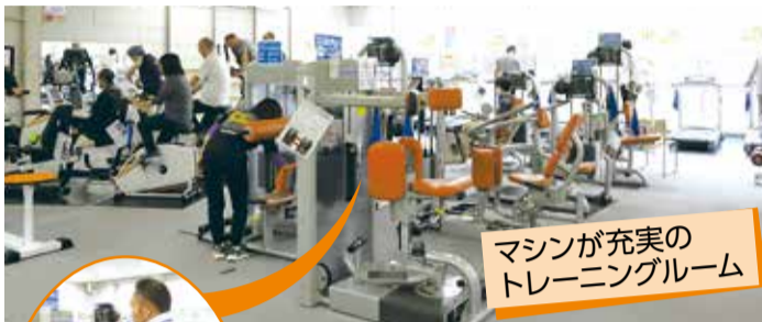
マシンが充実のトレーニングルーム

卓球やバドミントンができる大・中体育室の他、屋内プールやトレーニングルーム、柔・剣道場や弓道場もあり、さまざまなスポーツができる総合体育館です。