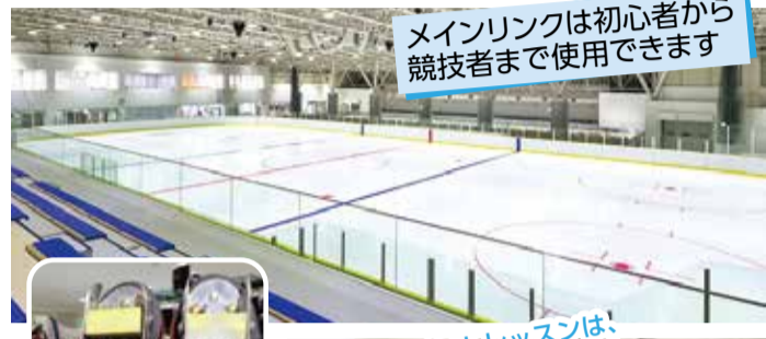
メインリンクは初心者から競技者まで使用できます

冬以外でもスケートやカーリングを楽しむことができます。全国的にも珍しい通年営業のリンクです。年中無休でいつでも楽しむことができます。