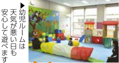
幼児ルームは、天気が悪い日も安心して遊べます

代謝が落ちる冬は、ランニングやマシンを使用した有酸素運動がおすすめです。体力測定を受けた方に専用のトレーニングメニューをつくります! (要予約)