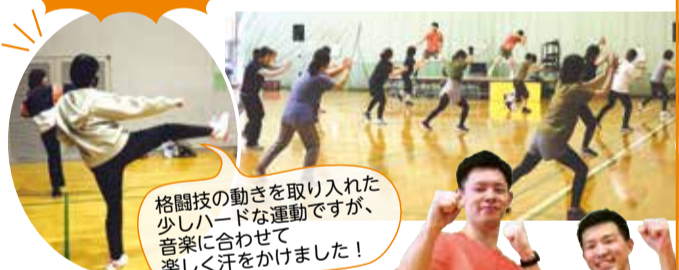
格闘技の動きを取り入れた少しハードな運動ですが、音楽に合わせて楽しく汗をかきました!

私たちの動きを真似することから始めてみましょう。ストレス発散、脂肪燃焼も期待できます!