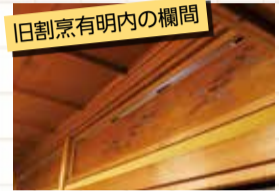
旧割烹有明内の欄間

特に私たちの印象に残ったところは細かいところに風情を感じるような工夫がされてあったところ。原木を加工せずにそのまま柱に使っていたり=写真左=、木材に鳥などが彫られていたり=写真右=、私たちが普段気にしないようなところにさまざまな工夫がされていて心が引かれました。