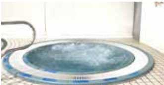
▲疲れたらジャクジーで休憩も

25mが14コースあり、しっかり泳ぎたい人向けの「スイムコース」やのんびり歩きたい人向けの「ウォーキングコース」などレーンが分かれていて、誰もが利用することができます。