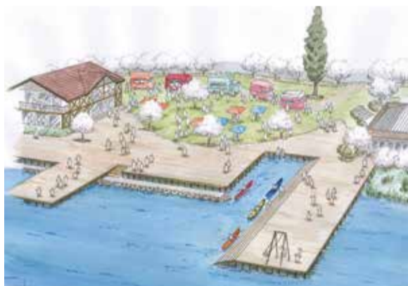
「とやのテラス(仮称)」イメージ

回 2月15日(土)午後1時30分～3時50分 ※受け付けは1時から 場 県生涯学習推進センター(女池南3) 内 中央区自治協議会第3部会が考えた鳥屋野潟で水辺を楽しめる公園「とやのテラス(仮称)」の構想を提案するフォーラム 入 先着186人 申 2月13日(木)までに右の二次元コードを読み取り申し込み 問 同会事務局(地域課、☎223-7023)