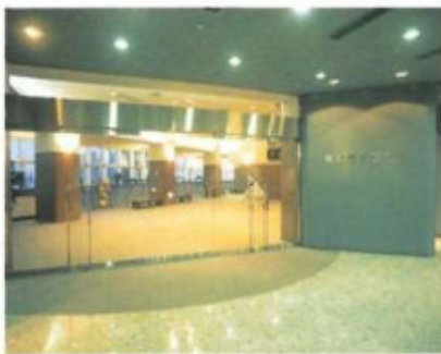
エントランスより