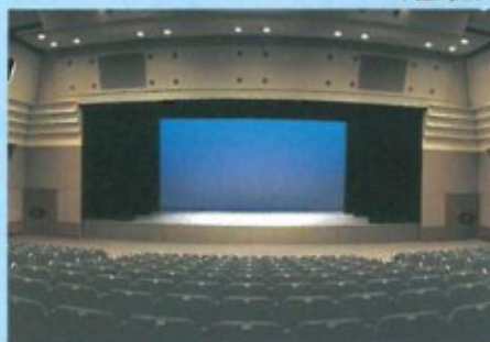
プロセニウム形式

〒951-8061 新潟市中央区西堀通6番町866番地 NEXT21ビル6階 TEL (025) 226-5500 (代) FAX (025) 226-5503 URL http://www.niigata-siminplaza.ecnet.jp/ 指定管理者/株式会社新潟ビルサービス TEL (025) 228-3477 施設設置者/新潟市中央区役所地域課 TEL (025) 223-1000