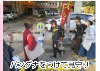
バンダナをつけて見守り