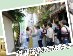
古町花街まちあるき