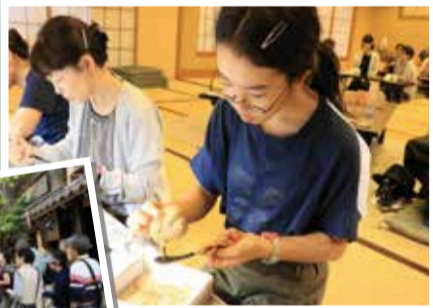
かき正はなれでの伝統工芸体験