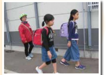
有明台コミ協による見守り活動(ひまわりクラブを利用する児童の帰宅支援)