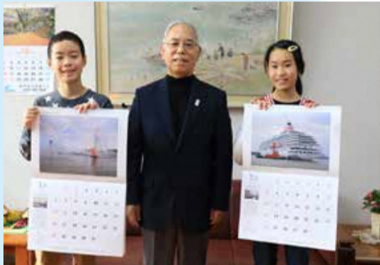
鏡淵小学校の子どもたちに外内座長(写真中央)よりカレンダーを贈呈(各クラスに掲示予定)

日頃、何気なく目にしている新潟西港の美しい風景や港で活躍する船舶、開港から現在までの歴史などに興味を持っていただき、今後の新潟市の発展・繁栄を考える機会となることを願っています。