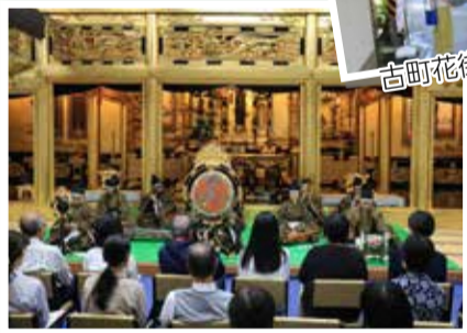
勝楽寺での雅楽演奏会