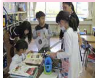
新潟「じまん」を学習中

子どもたちが地域に愛着と誇りをもって健やかに育ち、地域のつながりが紡がれていく一助となれば幸いです。