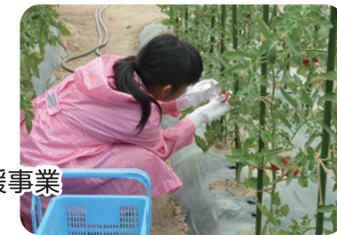
アグリパークでの収穫作業

2-2 一人一人の成長を促す生徒指導の推進 【推進する事業】 ◇いじめ対策等生徒指導推進事業