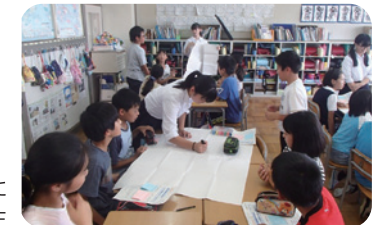
一つの課題に取り組む小中学生

施策3-2 外国語教育・国際理解教育の充実 【推進する事業】 ◇外国語教育支援事業 施策3-3 情報教育の充実とICTを活用した教育の取組 【推進する事業】 ◇タブレット等ICT活用研修 施策3-5 海外帰国・外国人児童生徒への教育の推進 【推進する事業】 ◇外国人児童生徒への支援体制の整備 施策11-1 効果的な指導を支援する施設設備の充実 【推進する事業】 ◇教育ネットワーク整備事業