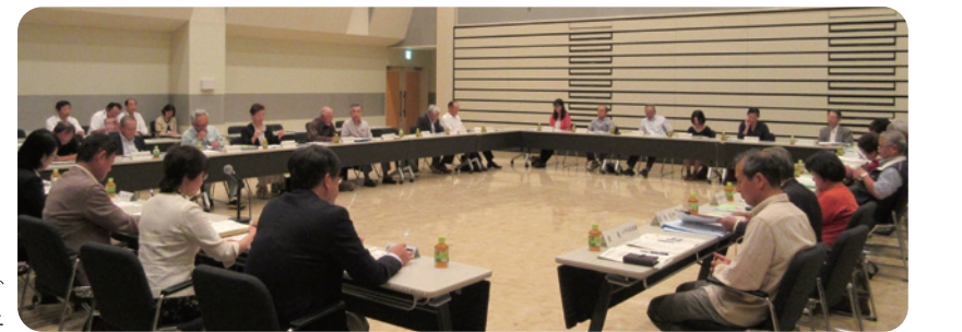
教育ミーティングの様子

施策10-1 防災・安全教育の充実 【推進する事業】 ◇「防災教育」学校・地域連携事業 施策10-4 学びを支援する体制の整備と充実 【推進する事業】 ◇奨学金貸付事業 施策13-1 新潟らしい教育改革の推進 【推進する事業】 ◇区教育ミーティングの開催 ◇中学校区教育ミーティングの開催