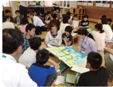
保護者や地域の方々など意見交換する子どもたち