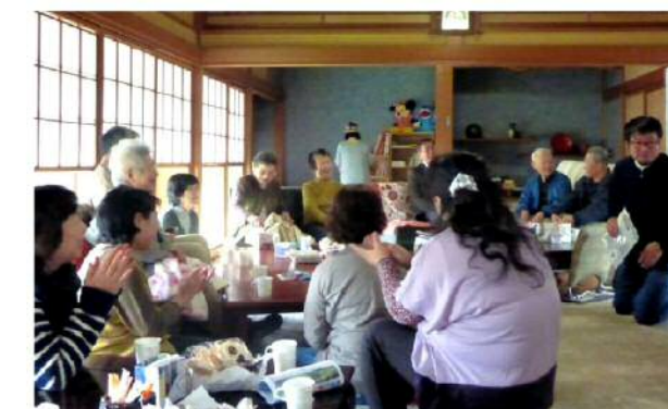
参加者は日平均20～40人。午前10時から午後4時まで出入り自由。

寄付品による即売バザーも行い、運営費に充てている。また、エアコンやストーブ、冷蔵庫などは地元企業からの寄付。