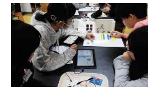
プログラミングの学習