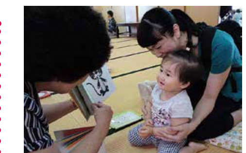
ブックスタート事業