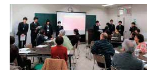
学習成果を発表する場の提供