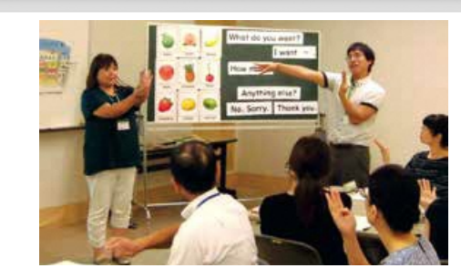
教職員研修(外国語)