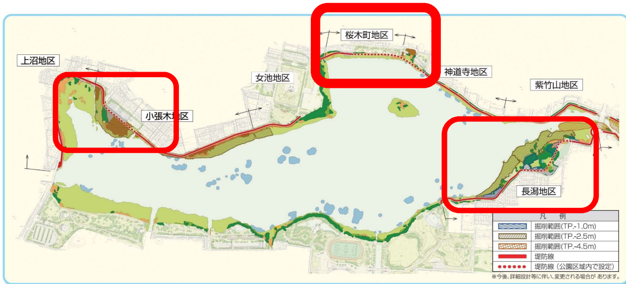
「鳥屋野潟の自然環境」 発行：新潟県 H28.2