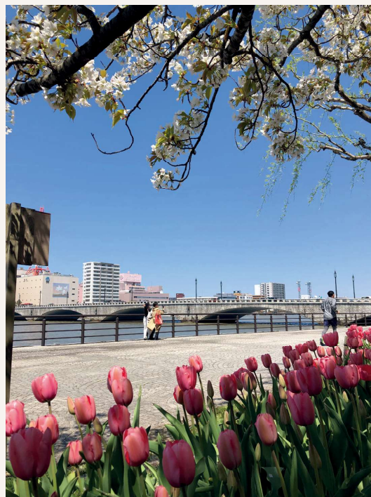
チューリップとやすらぎ提