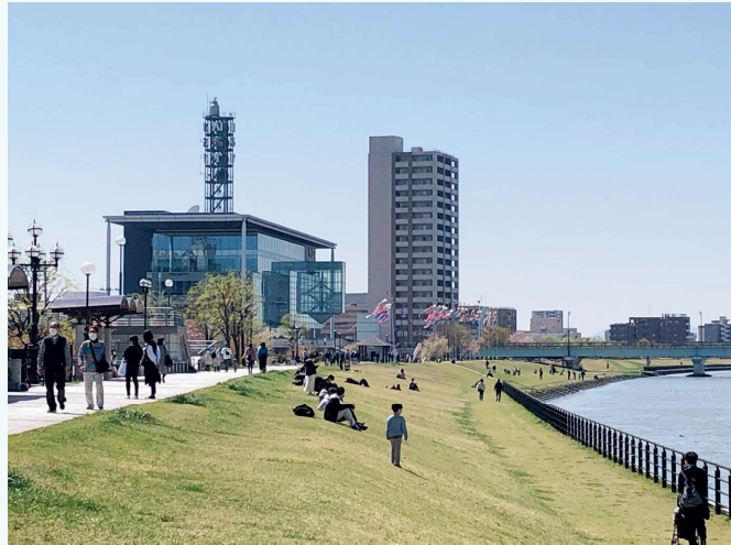
信濃川やすらぎ堤