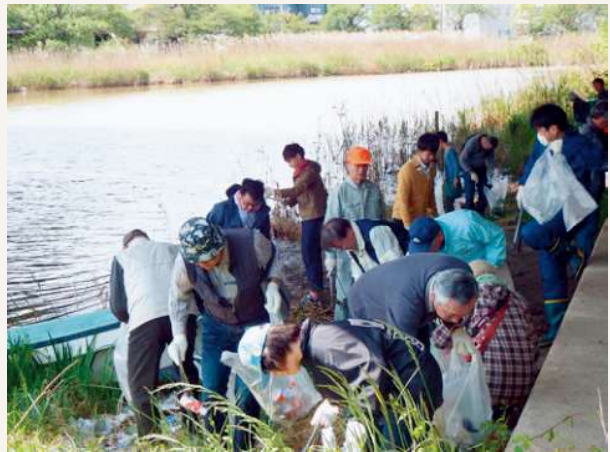
鳥屋野潟一斉清掃