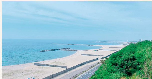
日和山浜海水浴場