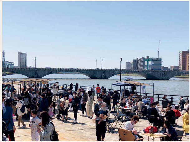
万代テラスのにぎわい