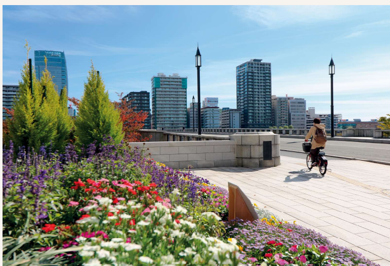
緑豊かな都市空間