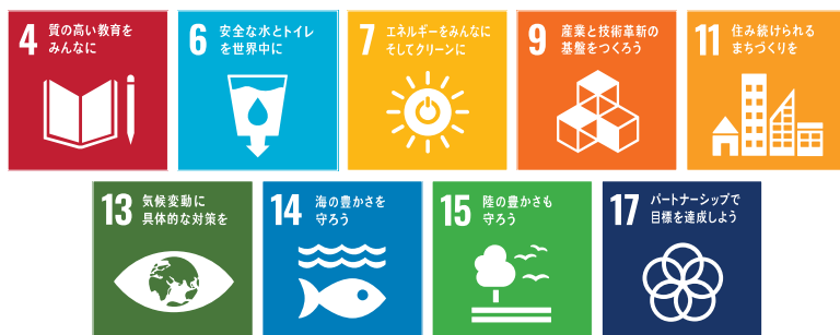
まちづくり計画体系図（再掲）