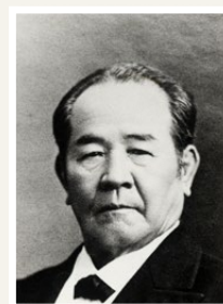
渋沢栄一(埼玉県深谷市所蔵)

1970年東京上野生まれ(ルーツは旧京ヶ瀬村)。1999年明治大学大学院経営学研究科博士後期課程中途退学。同年長岡短期大学専任講師、2002年長岡大学専任講師、12年教授。2019年より現職。明治大学大学院経営学研究科兼任講師、株式会社第四北越フィナンシャルグループ社外取締役(監査等委員)、新潟日報読者・紙面委員、一般社団法人地域ルネッサンス創造機構シンクタンク・ザ・リバーバンク副理事長、東山油田(史跡・産業遺産)保存会長を兼務。趣味は東京ヤクルトスワローズの応援(40年以上)と落語・演芸、適度な飲酒。