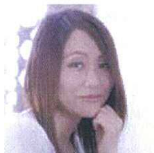
ちあい文々 (Chai bunbun)

1977年、新潟県新発田市生まれ。新潟大学経済学部卒業。WEB、イラストレーション、アニメーション等、幅広いメディアに向けてデザインを展開している。最近の作品には、AGF MAXIM『Latte Motion』（キャラクターデザイン、アニメーション）、SPACE SHOWER TV『SWEET LOVE SHOWER 2014』（メインビジュアルイラストレーション）、Benesse『Let's Sing & Dance! meet TEMPURA KIDZ』（WEBデザイン、コーディング）、などがある。