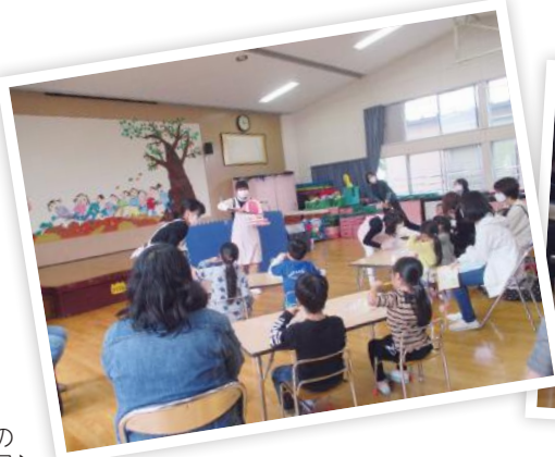
牡丹山幼稚園での虫歯予防教室の様子▶

子どもの虫歯を減らす取り組みとして、こども食堂や、保育園、幼稚園などと連携し、虫歯予防教室や歯と食育の健康相談会を実施しました。歯科衛生士が模型を使って歯磨き指導をしたほか、歯と食育の健康相談会では、歯磨きの習慣を定着させるための「歯っぴーすまいるチャレンジカード」を配布しました。