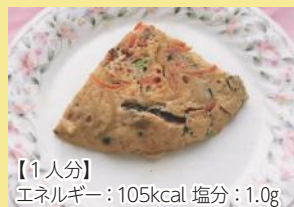
【1人分】 エネルギー: 105kcal 塩分: 1.0g

料理の温度が低くなると塩気を強く感じます。冷めてもおいしく食べるために、加熱時は少し薄めに味付けしましょう。